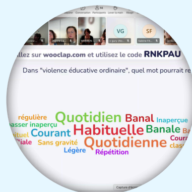
À distance (visio)

52 sessions de formations, tous domaines confondus, dispensées depuis 2024 !