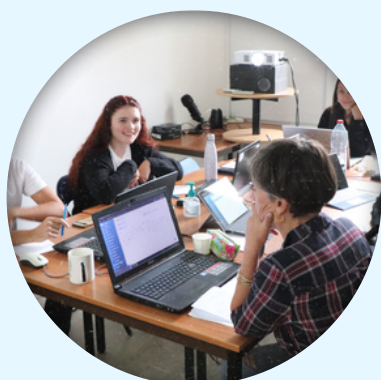
Dans nos locaux