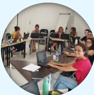
Dans votre structure